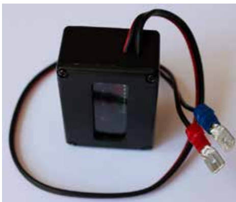
Transponderen måler 37x 53 x 22 mm. (B x H x D)

På den fri plads, må der ikke være rallymærker eller anden tekst eller lign. på ruden.