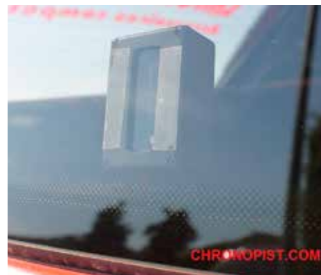
Transponderen monteres af løbets officials ved teknisk kontrol, og den placeres nederst i højre siderude.