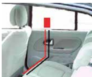
Kablerne trækkes så transponderen nemt kan tilsluttes strøm.

På youtube.com kan du finde flere videoer, søg på "balise chronopist" eller kik på chronopist.com (hjemmeside på fransk)