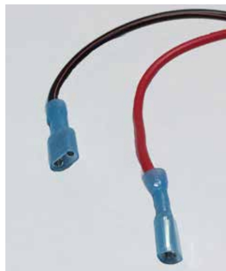
Kablerne ved transponderen skal være tilpas lange, så de ikke "trækker" i enheden og forsynes med kabelsko af typen med isolering på hele stikket

På youtube.com kan du finde flere videoer, søg på "balise chronopist" eller kik på chronopist.com (hjemmeside på fransk)