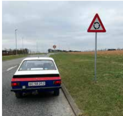
3431 m (ved skilt Rundkørsel)

Alle mål er taget vinkelret på de viste terrængenstande.