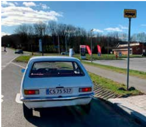
0 m (Ved busskilt)

Start ud for busskilt på Boulevarden, Vejen