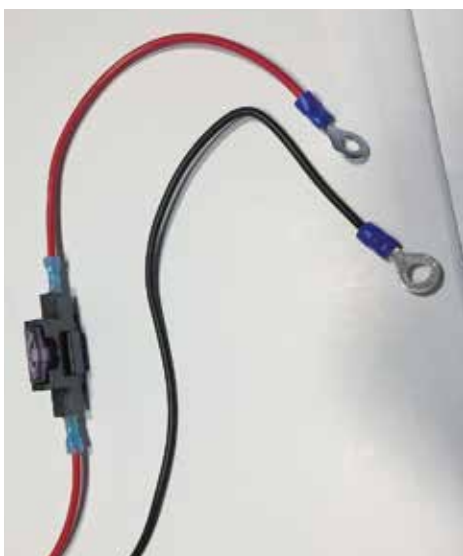
Kablerne skal monteres direkte på batteriet og +ledningen forsynes med en sikring på 3-5 amp.